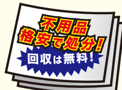
チラシやダイレクトメール