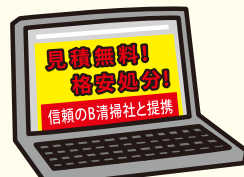
ホームページの情報

「不用品を無料で回収」。この魅力的なフレーズこそが落とし穴です。回収は無料でも「運搬や処分は別料金である」として、法外な金額を要求してくるというケースや、問い合わせの段階では無料回収と言いながら、引き取りの段階になって「思っていたより品物が大きいから」「処分費用が高騰しているから」などと理由をつけ、高額な料金を要求してくるというケースが多数報告されています。これはもはや悪徳業者の常套手段であると言えます。